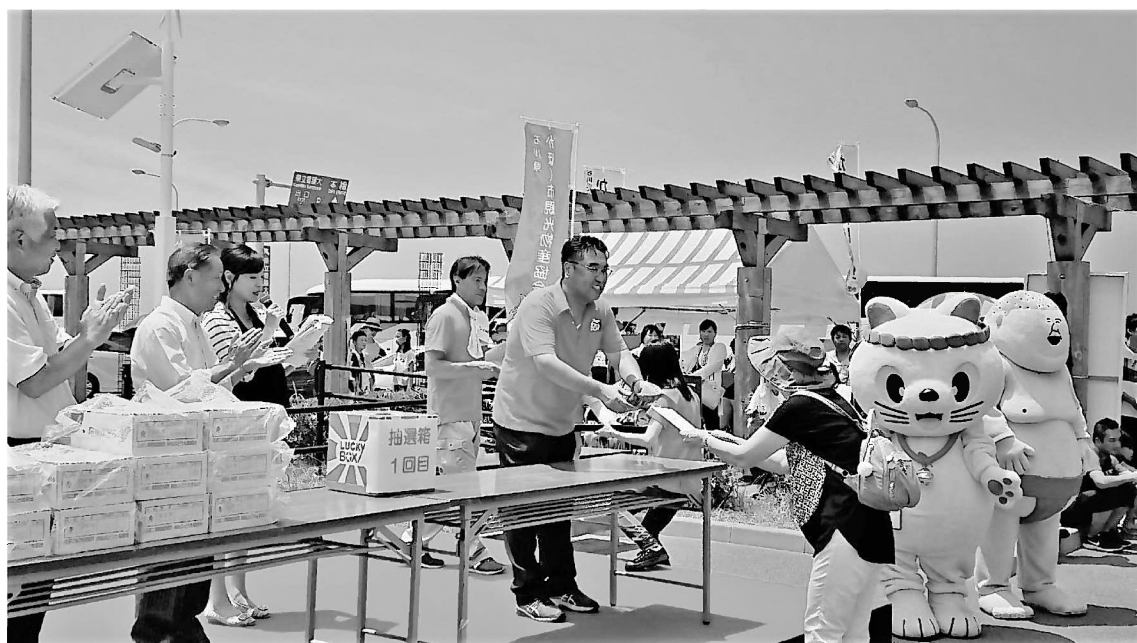
里山里海フェア in 道の駅高松 2018